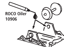
ROCO Oiler 10906

Les pièces de finition illustrées sont à monter par le modéliste. Le jeu de pièces peut comprendre d'autres pièces (non illustrées) qui sont destinées à autres versions du modèle et qui sont superflus à la variante présente.